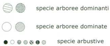
Schema di sesto di impianto per macchie o fasce boscate